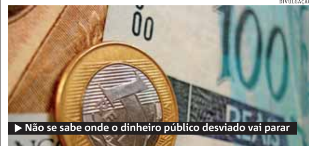
► Não se sabe onde o dinheiro público desviado vai parar