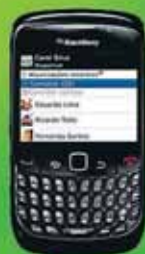
BLACKBERRY® CURVE 8520

TIM LIBERTY • LIGAÇÕES ILIMITADAS TIM-TIM E PARA RÁDIOS*