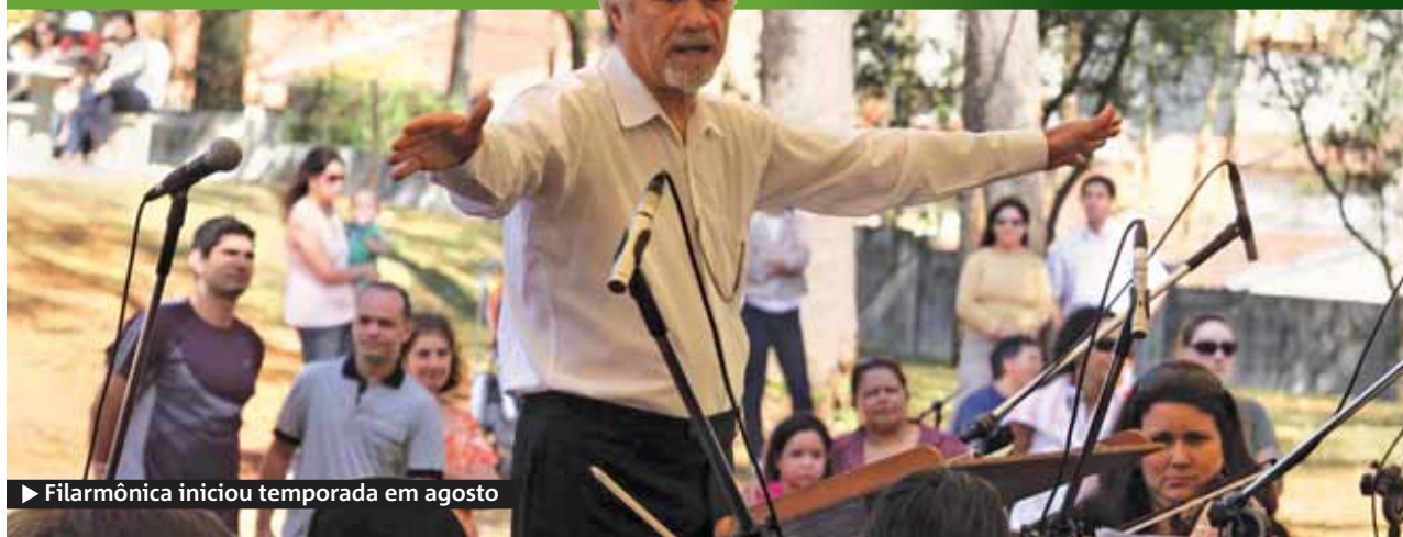
► Filarmônica iniciou temporada em agosto