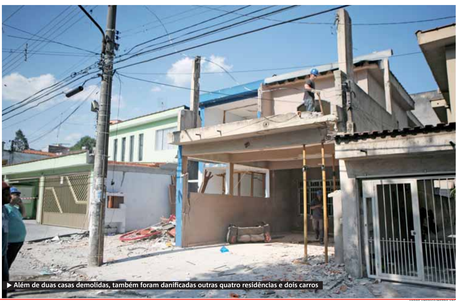
► Além de duas casas demolidas, também foram danificadas outras quatro residências e dois carros

► Acidente causado por vazamento de bujão de gás no Jardim João Ramalho causa queimaduras graves em menino de 11 anos e ferimentos leves em sua avó ► Duas residências foram demolidas pela Defesa Civil {pág 02}