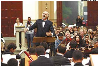
Mozart, Tchaikovsky, Puccini, Haydn e Bottesini estarão no repertório

Para dar início à noite, a abertura da ópera mozartiana Così Fan Tutte . Em seguida, Variações Sobre Um Tema Roccò , para violoncelo