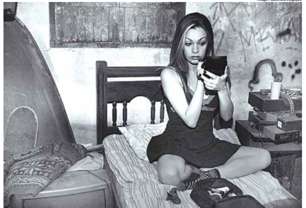
O curta Tutti Maria (Cosco Coifa) , de São Bernardo, faz parte de seleção especial que será exibida amanhã e dia 1º

O Grande ABC não fica de fora da festa e conta com dois representantes. Um deles é o curta Tutti Maria (Cosco Coifa) , do diretor André Brazi-