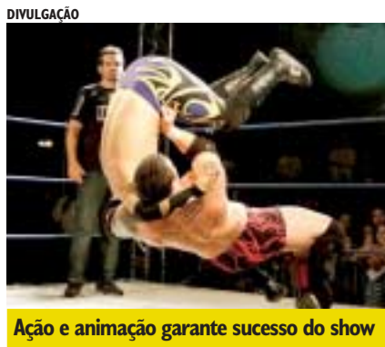
Ação e animação garante sucesso do show

Os Campeões do Ringue com o Show de Telecatch - Luta Livre estarão em São Caetano neste sábado no CER Cespro, no Bairro Prosperidade. A entrada é gratuita.