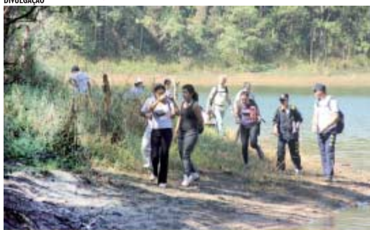
Trilha no Riacho Grande, próxima a um remanescente da Mata Atlântica