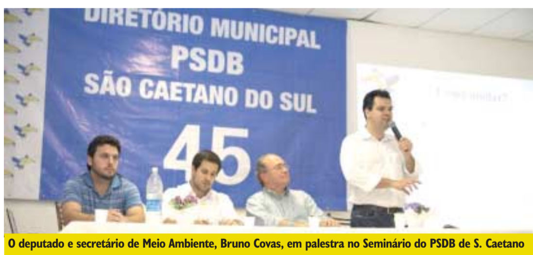
O deputado e secretário de Meio Ambiente, Bruno Covas, em palestra no Seminário do PSDB de S. Caetano