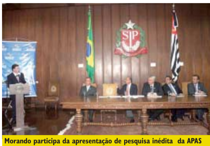
Morando participa da apresentação de pesquisa inédita da APAS