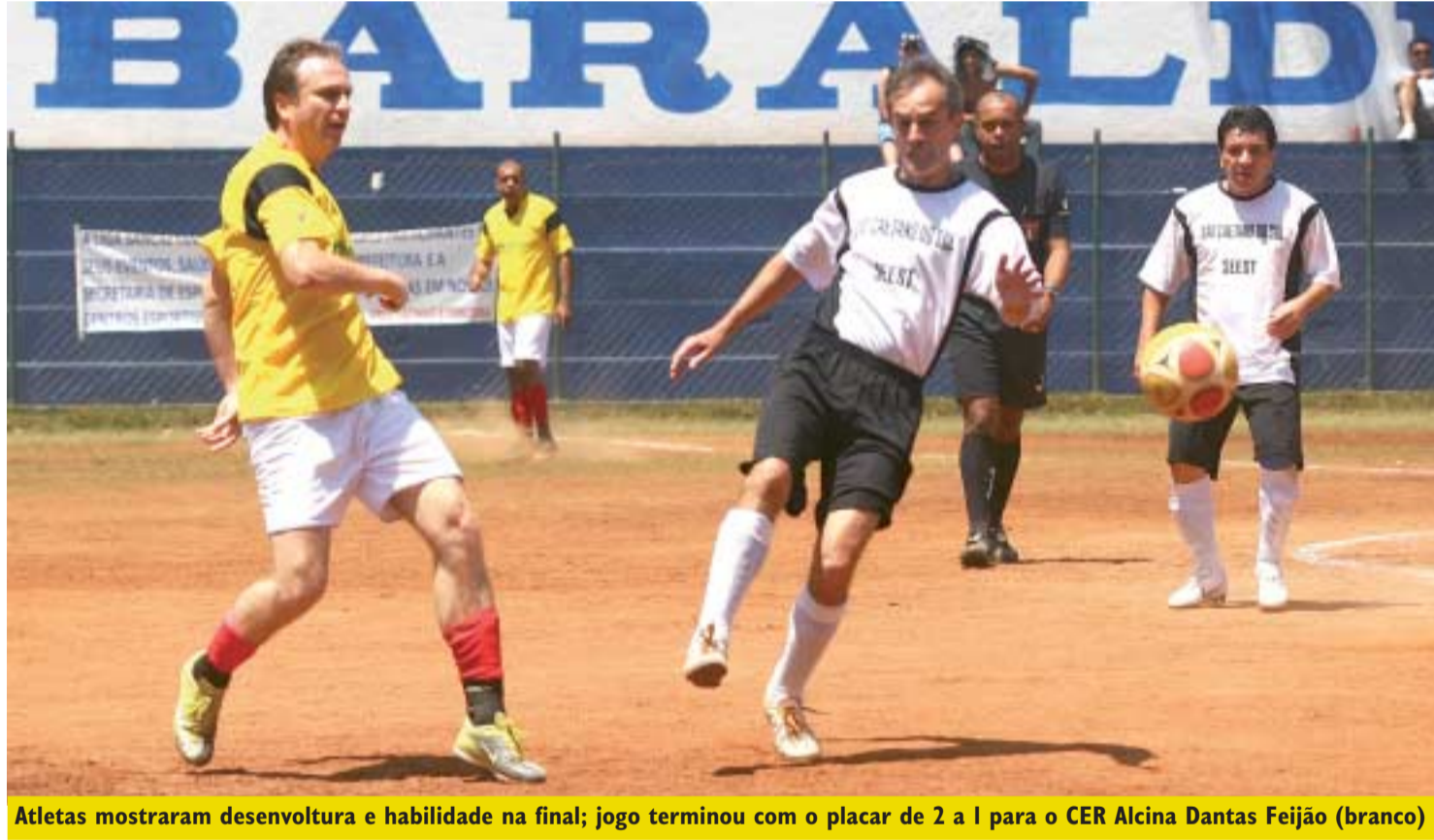
Atletas mostraram desenvoltura e habilidade na final; jogo terminou com o placar de 2 a 1 para o CER Alcina Dantas Feijão (branco)